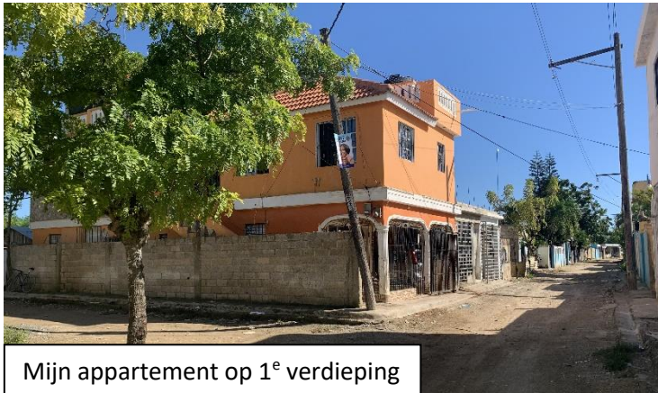
Mijn appartement op 1 e verdieping

Buiten de geluiden van spelende kinderen. Als ik door de ramen kijk zie ik allemaal half afgebouwde stenen huizen met betonnen daken waar vaak de wapeningsprietten uitsteken voor het moment dat er weer geld is voor een volgende verdieping. De straten zijn ongeplaveid met nu de sporen van de regenstroom. Hier en daar wat groen en verder een wirwar van elektriciteitsdraden waar iedereen betaald en onbetaald van aftapt. Het heet Barrio Villa Faro, een "uitbreidingswijk" ten zuiden van de havenstad San Pedro de Macoris. Wij zouden het misschien wel een sloppenwijk noemen maar voor mij is het een wijk waar mensen gewoon de woeste grond langs de zee zijn gaan ontginnen om woningen te bouwen en die langzaam transformeert naar een stadswijk met verharde wegen en trottoirs.