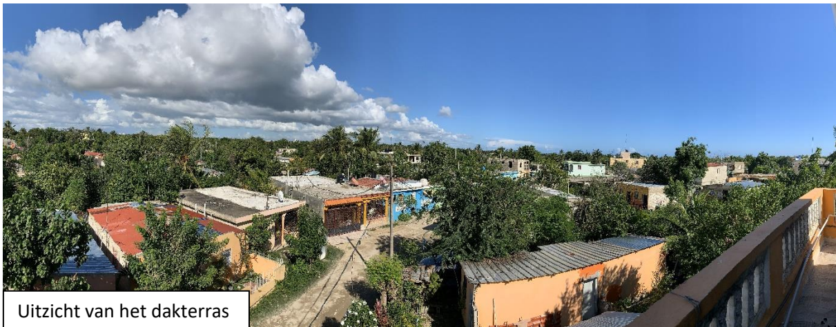
Uitzicht van het dakterras